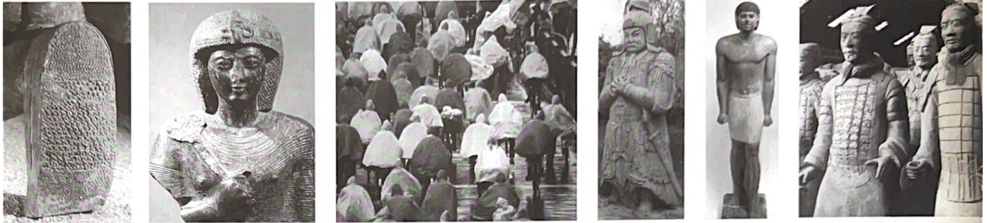
Voorbeelden uit de kunst

Een stad zonder mensen is een dode stad, een stad met allemaal forensen is een saaie slaapstad, een kleine gemeenschap is een dorp ... je moet je eigen weg kunnen gaan en tegelijkertijd niet verdrinken in de grootsheid. Groots in de kleinheid; klein in de grootsheid: de ideale stad is de stad waar je anoniem bent maar waar je wel gekend wordt en niet verdwaalt. Wij maken de stad. Mensen maken de stad.